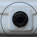
Recuadro para instalar brida de hasta 1 1/2"